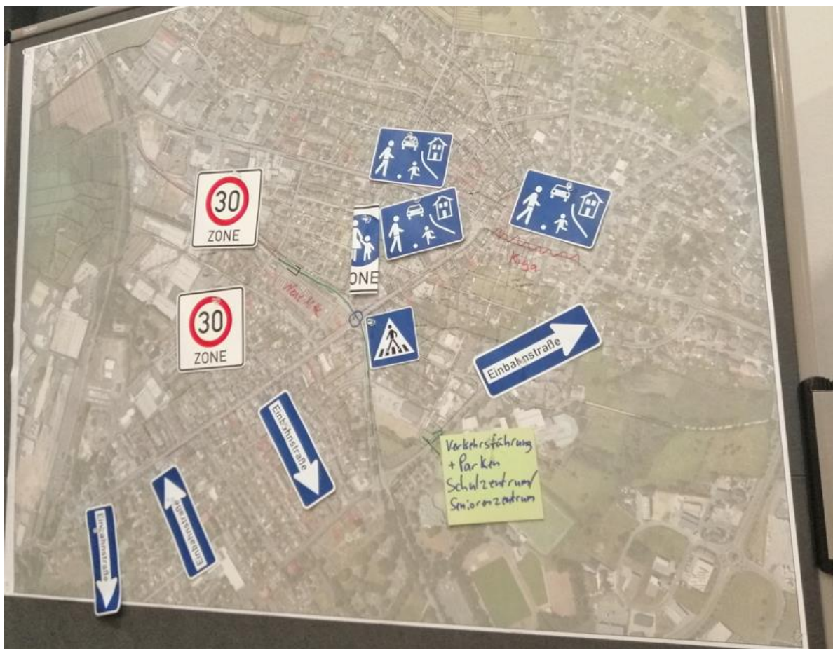
Vorschläge für die Verbesserung der Verkehrssituation

Gemeinsam wurden anhand des Stadtplanes Vorschläge für die Verbesserung der Verkehrssituation erarbeitet.