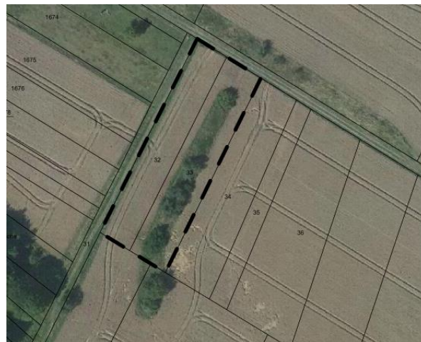
Abb. 3: Auszug Liegenschaftskarte, unmaßstäblich Flurstücke 32; 33, Flur 6