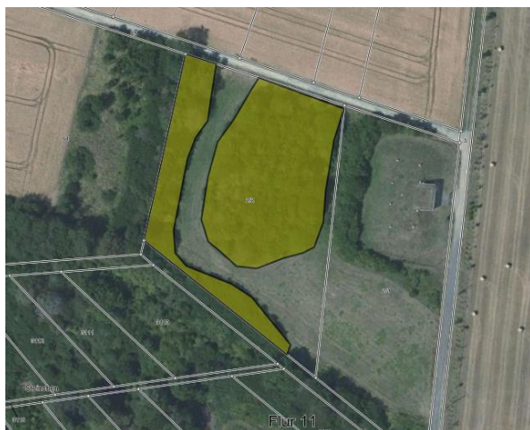
Abb. 2: Auszug LANIS, unmaßstäblich KOM-1565854537678

Um den in der Ursprungsplanung festgelegten Ausgleich umzusetzen, werden daher im Rahmen der 2. Änderung zudem die Grundstücke Flur 6, Nr. 32 sowie 33 (2.889 m 2 ) als Ausgleichsfläche festgesetzt.