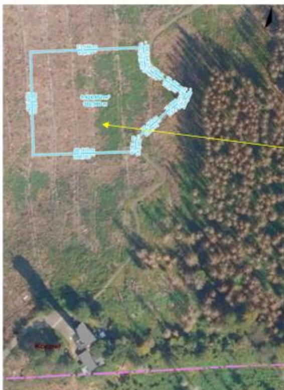
Auszug aus dem Liegenschaftskataster; unmaßstäblich (Ausgleichfläche)

Die Ausgleichfläche soll nach Abstimmung mit der Unteren Naturschutzbehörde und dem Forstamt im Bereich des Fußweges zum Köppel liegen (siehe Luftbildaufnahme)